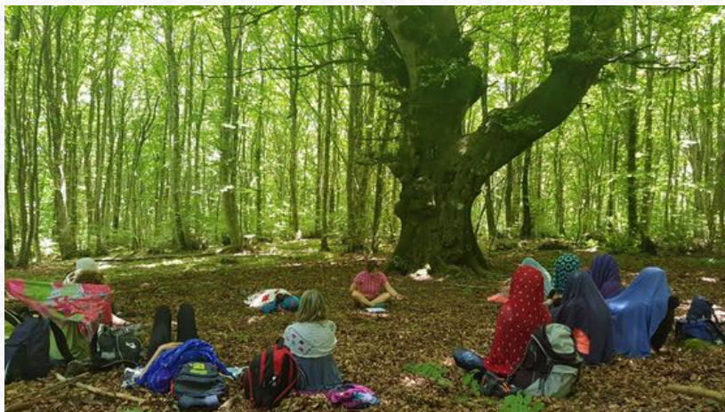
Pratiche nel bosco "Sussurro della Dea" 2021