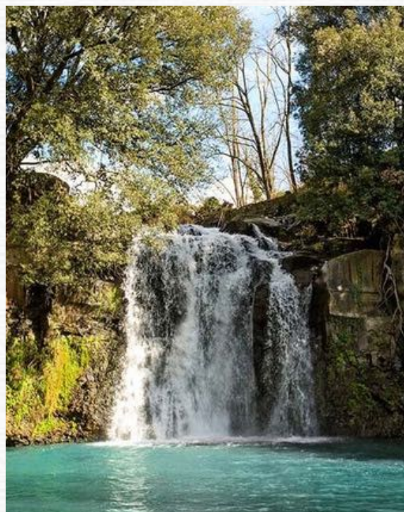
Cascata di Salabrone

VENERDÌ 24: Riserva del Lamone e Cascata del Salabrone, luoghi davvero unici e magici che rivestono un grande interesse sia storico che ambientale dove praticheremo in natura stabilendo una relazione con gli elementi.